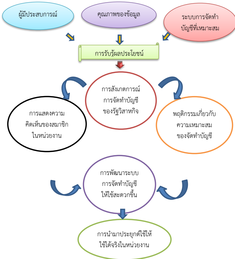
ภาพที่ 2 เครื่องมือการวิจัยและการออกแบบวิจัย

ระบบให้ดีขึ้นซึ่งควรเป็นคำถามที่เข้าถึงง่ายและในแบบสอบถามแบ่งออกเป็น 4 ด้านซึ่งสมาชิกของกลุ่มแม่บ้านเกษตรกรวังยาวพัฒนาได้นำมาวิเคราะห์ข้อมูลเพื่อพัฒนาการจัดทำบัญชีให้เป็นระบบและสะดวกมากยิ่งขึ้น