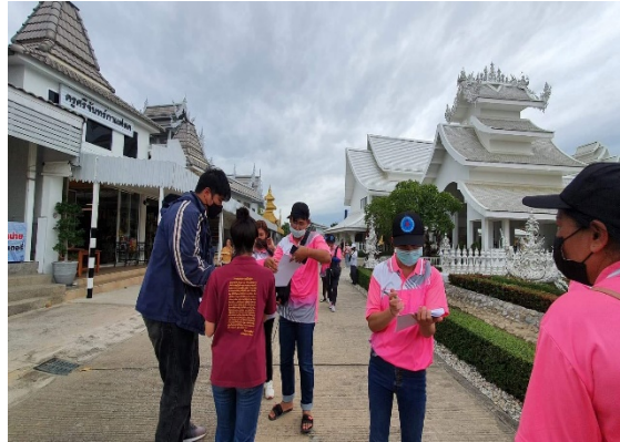
ภาพที่ 2 ลงพื้นที่เก็บข้อมูลนักท่องเที่ยวโดยใช้แบบสอบถาม

4.2 ใช้แบบสอบถามสัมภาษณ์กับบุคลากรและเจ้าหน้าที่ของวัดร่องขุน