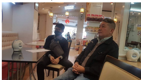
ภาพที่ 3 ลงพื้นที่เก็บข้อมูลผู้บริหาร บุคลากร และชุมชนวัดร่องขุน โดยใช้แบบสัมภาษณ์

ขั้นตอนที่ 5 จัดทำกลยุทธ์แผนพัฒนาปรับปรุง และนำเสนอข้อมูล