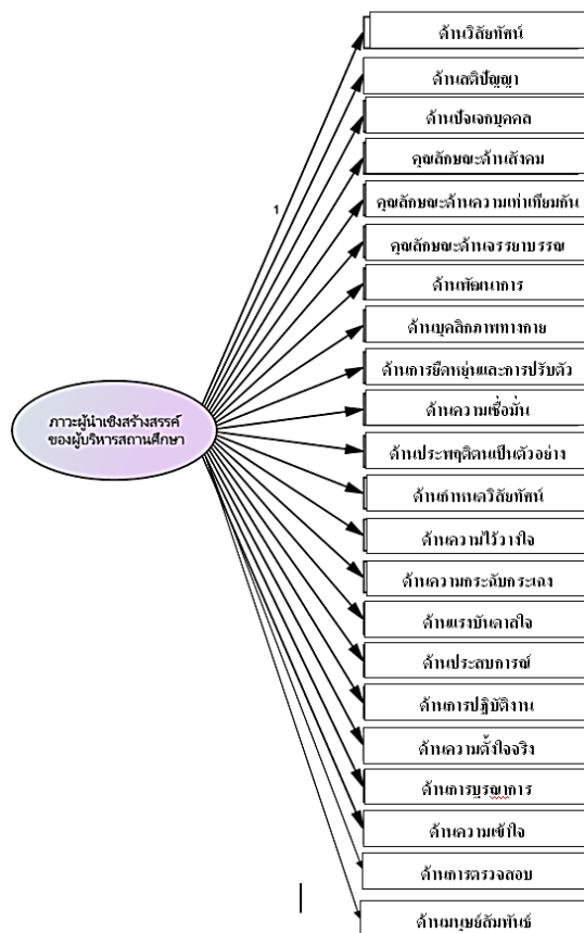
ภาพที่ 2 รูปแบบภาวะผู้นำเชิงสร้างสรรค์ของผู้บริหารสถานศึกษามัธยมศึกษา สังกัดสำนักงานศึกษาธิการ ภาค 6